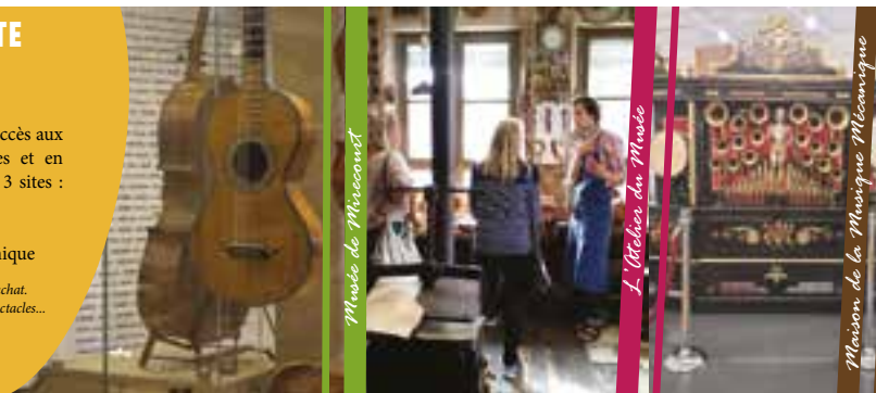
Musée de Mirecourt